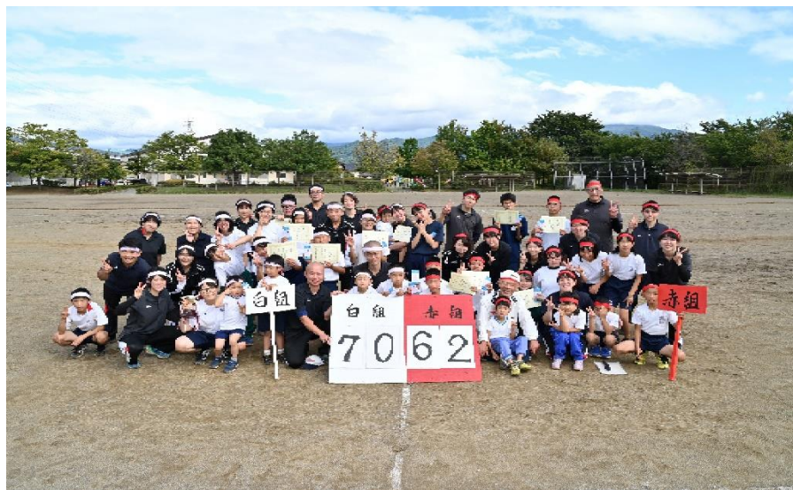
第5回愛育園運動会