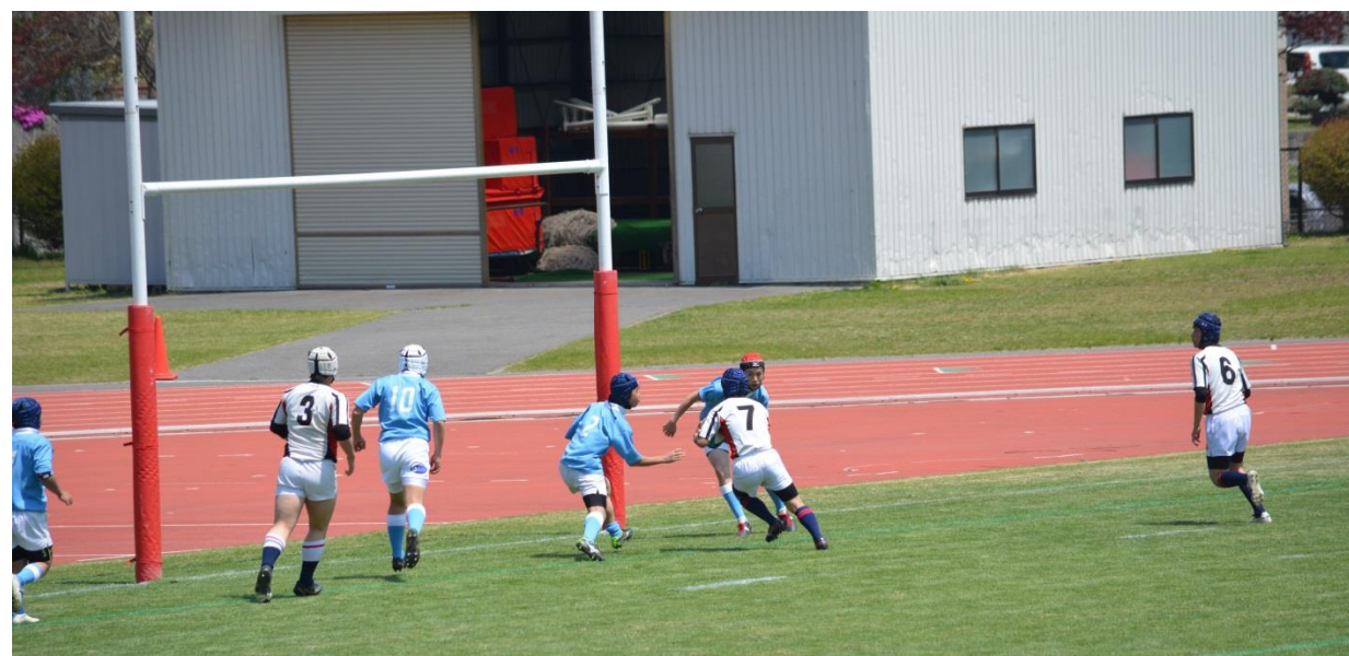
Figure 1 当園の児童（7番）がラグビー部で頑張っています。子どもたちが応援に行きました。

未だ分からない事が多くあり、自分ひとりではどうにもできない事も沢山あります。まずは、相談しながら、そして挑戦していきながら成長できる1年にしていきたいと思っております。